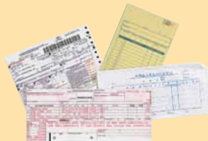
Documentos frágiles y finos Papel arroz • Guías aéreas • Formularios en papel autocopiativo

El diseño innovador de los scanners Kodak Ngenuity se materializa en unas características inteligentes que suponen un enorme cambio a la hora de ahorrar tiempo al organizar el papel, ajustar la configuración del scanner y preocuparse por la calidad de la imagen, y le permiten dedicar más tiempo a agilizar su flujo de trabajo y a mejorar sus resultados finales.